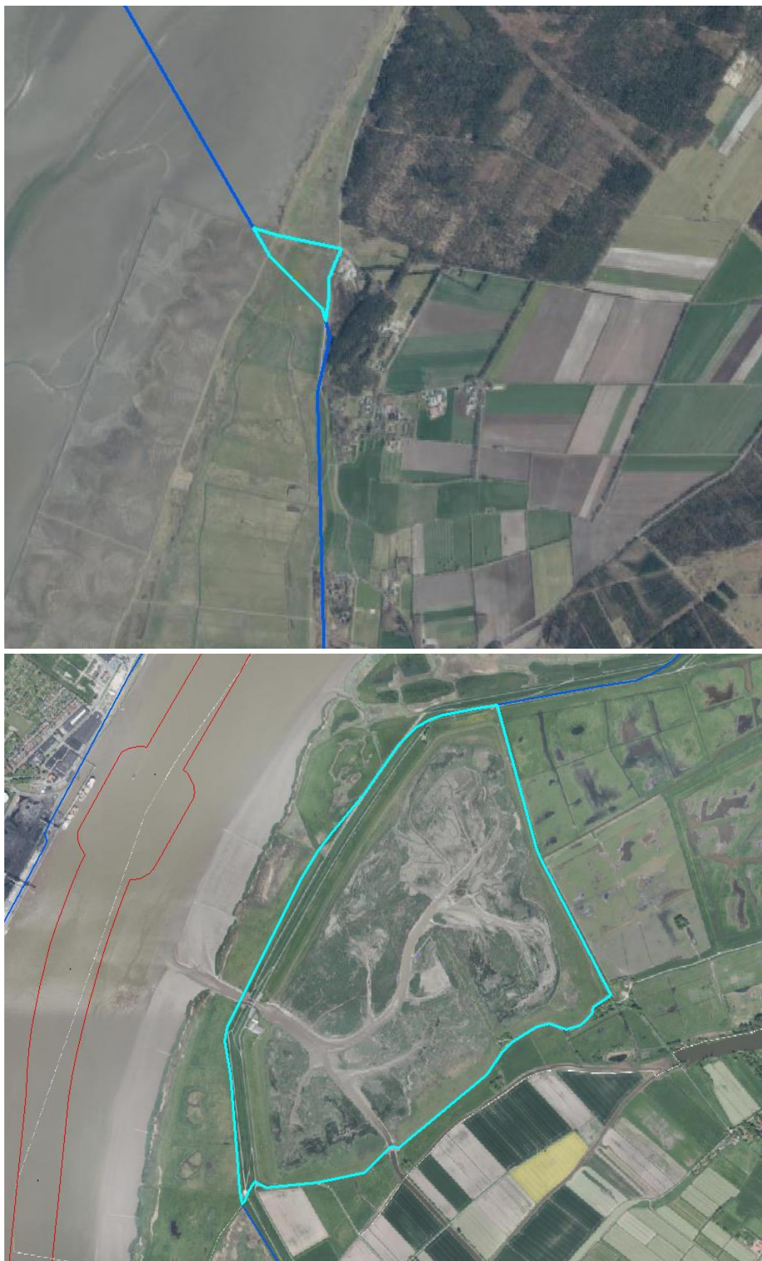
Abbildung 2: Anpassung/Erweiterung (türkis) des Betrachtungsraums aus dem Vorverfahren (dunkelblau) im Bereich Sommerpolder Arensch/Berensch (oben) und Tidepolder Luneplate (unten)