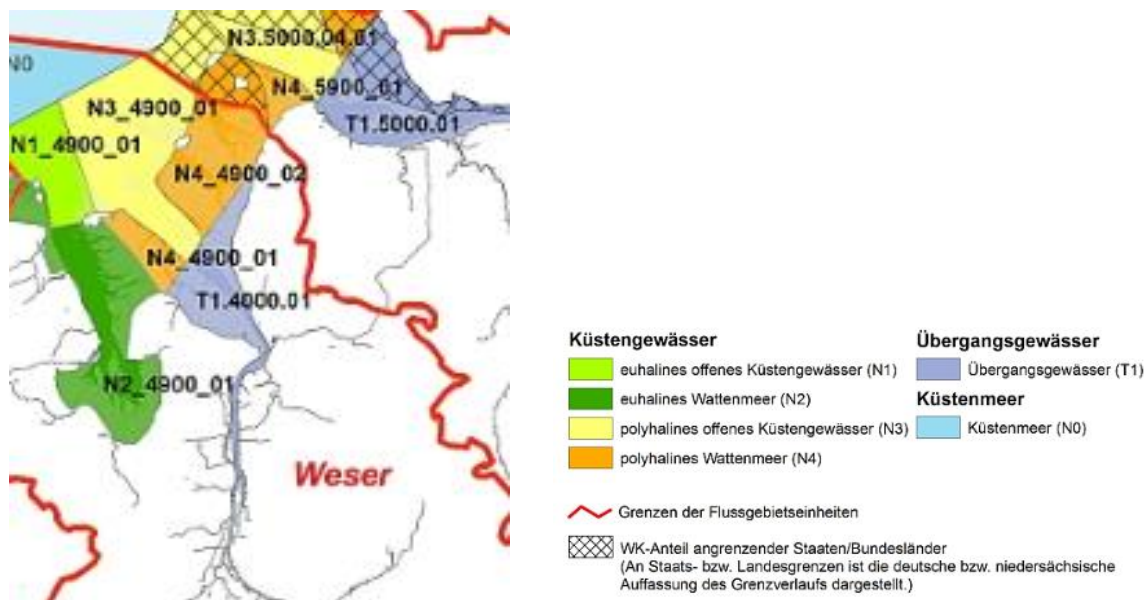
Abbildung 3: Übersicht der Gewässertypen und Flussgebietseinheiten der niedersächsischen Küste

Abbildung 3 gibt eine Übersicht über die an der niedersächsischen Küste vorkommenden Gewässertypen und Flussgebietseinheiten. Im „Betrachtungsraum Weser“ vertreten sind die Typen T1 – Übergangsgewässer (Unter- und Außenweser), N3 – polyhalines offenes Küstengewässer sowie N4 – polyhalines Wattenmeer. Binnendeichs in dem (Teil)Betrachtungsraum zur Salzintrusion kommen zudem Gewässer des Typs Typ 22.1 – Gewässer der Marschen vor.